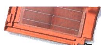
Zonnecollectoren in pannen