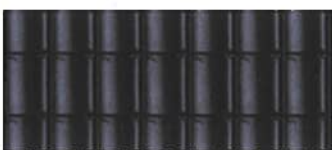
Zwart gesmoorde pannen