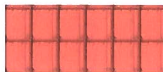
Oranje keramische pannen