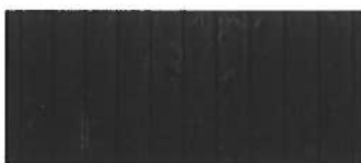
Zwart gebeitst hout