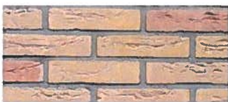
Gele (handvorm) baksteen