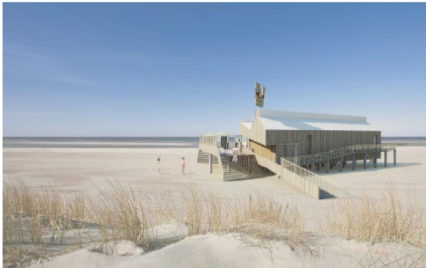
Impressie strandpaviljoen. De walvis als windwijzer verwijst naar de historie van het eiland

Los van de recreatieve meerwaarde voor het eiland zal het strandpaviljoen naar inschatting 10 permanente arbeidsplaatsen opleveren (6 fte).